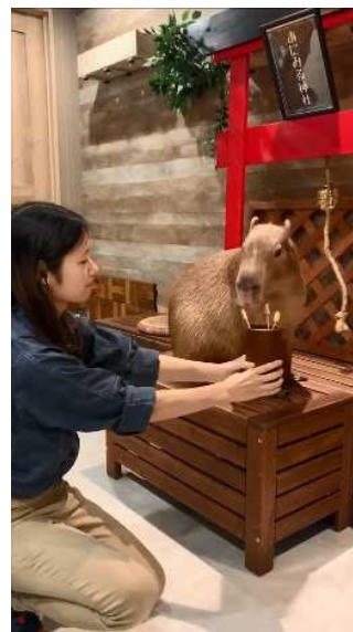
写真：おみくじを引く場面

ほのぼのとしたイメージの強いカピバラですが、意外と知られていない知能の高さを間近でご覧頂けます。アニミルでは他にも縁起が良いとされる動物が昼（ピクニックタイム）、夜（キャンプタイム）と時間帯によって登場します。ふれあいや、記念撮影、おやつ体験など動物たちのエネルギッシュなパワーを全身で受け止めて下さい！