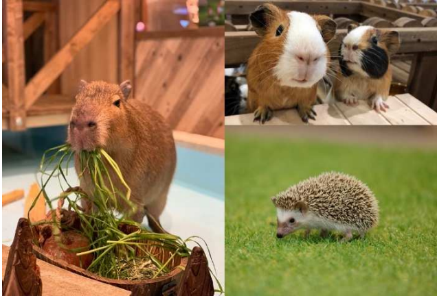
カピバラ・モルモット：ピクニックタイム