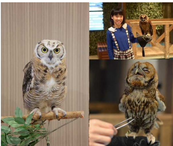
フクロウ：キャンプタイムに登場

古来より親しまれている学業成就にとどまらず、フクロウ＝不苦労といった語呂合わせや、首が良く回ることから商売繁盛のご利益、目の良さからチャンスや縁を見極める力が得られるとされるといった多岐に渡るご利益の持ち主！