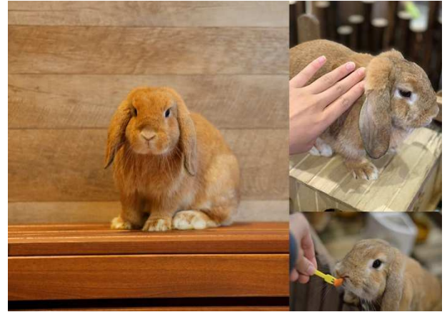
ウサギ：ピクニックタイムに登場

前にしか進まない(後ろに下らない)や、ツキ(月)を呼ぶといった幸運を表すとも言われています